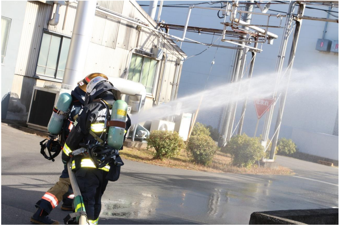
消防隊消火活動の様子