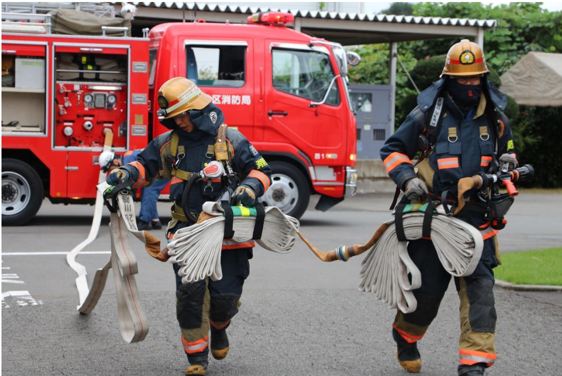
消防隊のホース延長活動の様子