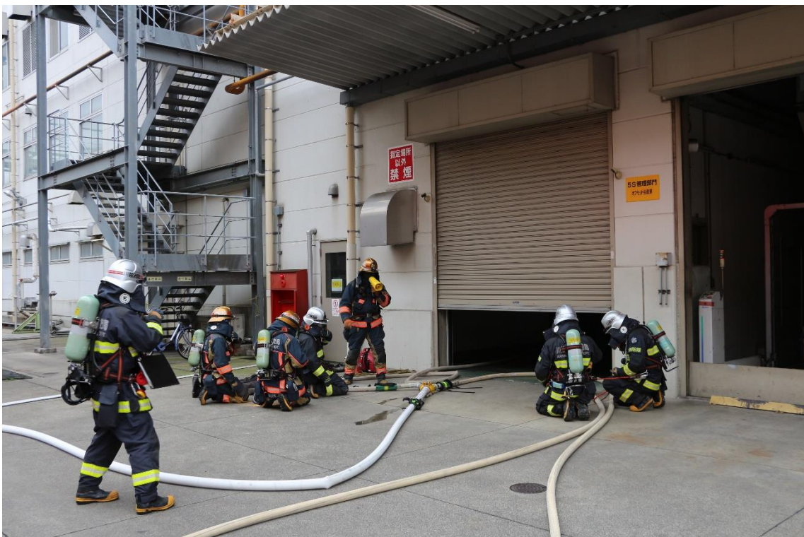
屋内進入活動の様子