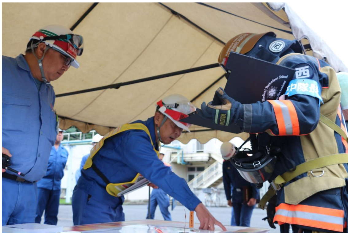
消防技術説明者と消防との情報共有の様子