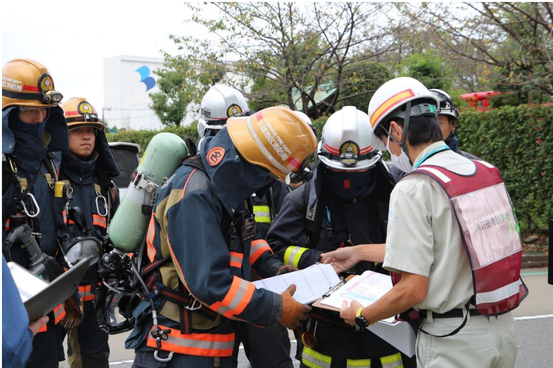
消防技術説明者と消防との情報共有の様子