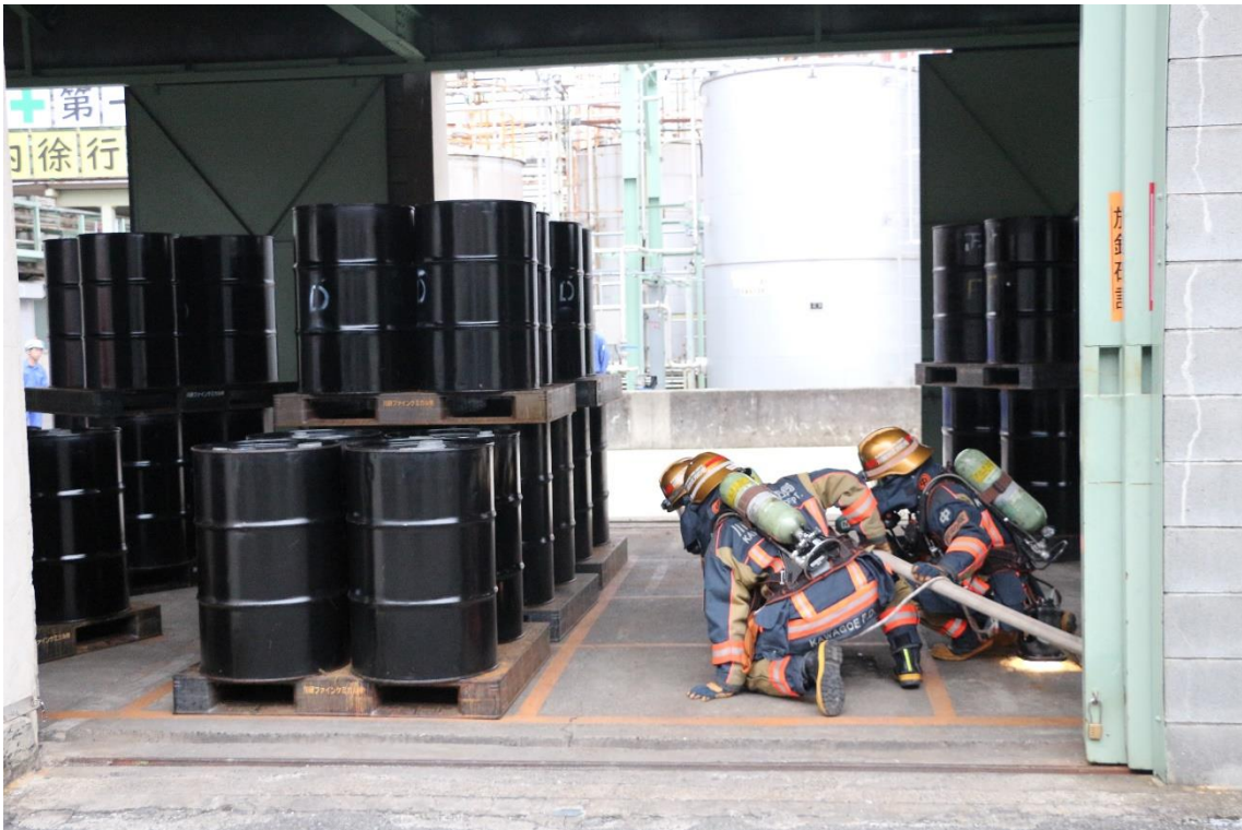
屋内検索活動の様子