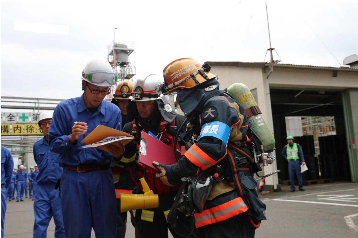
消防技術説明者と消防との情報共有の様子