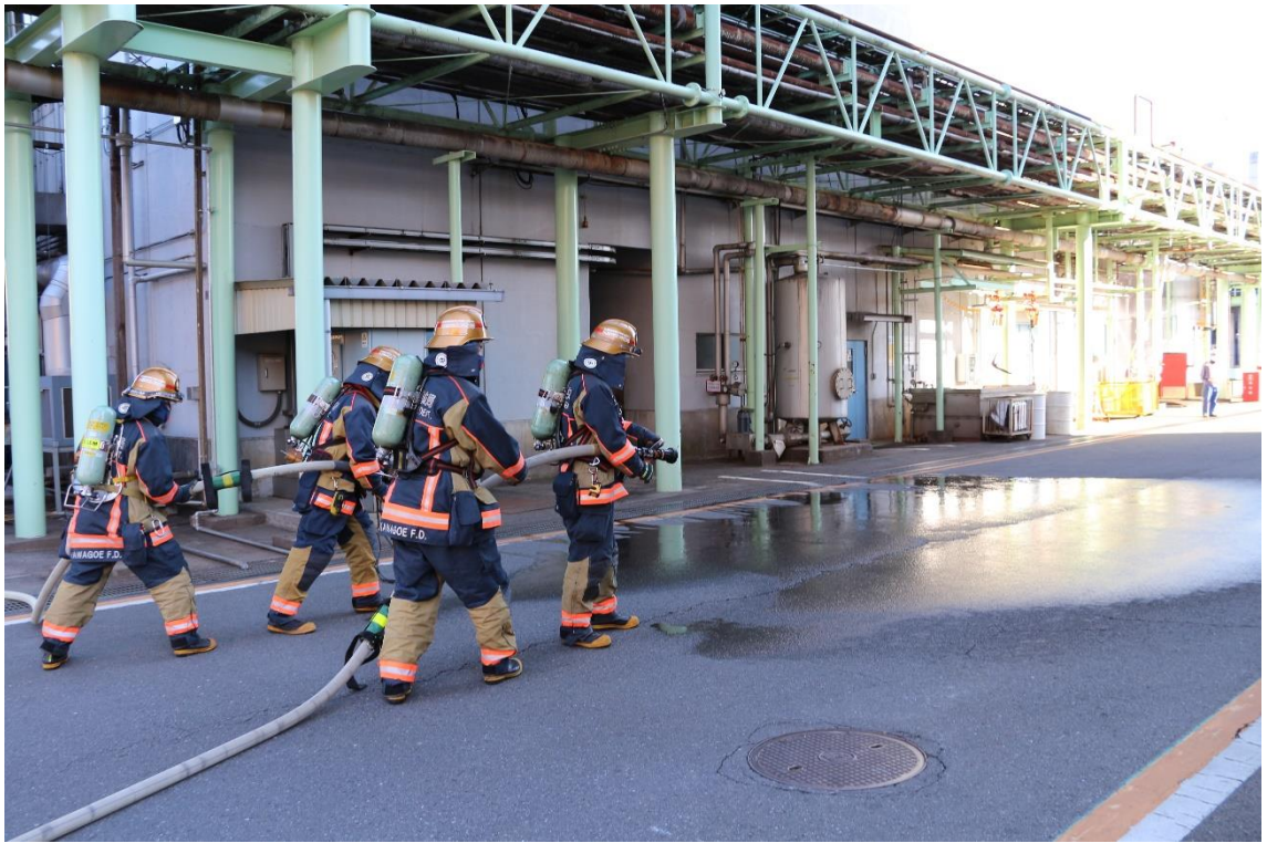
消防隊消火活動の様子