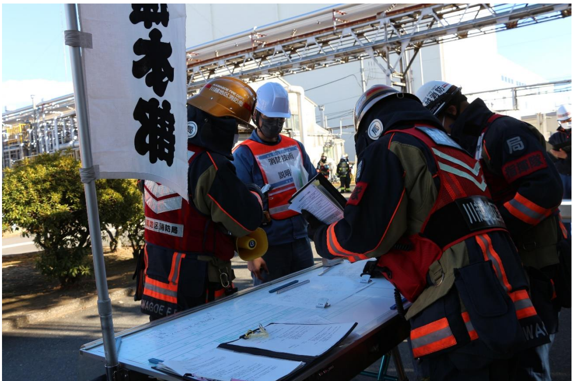
消防技術説明者と消防との情報共有の様子