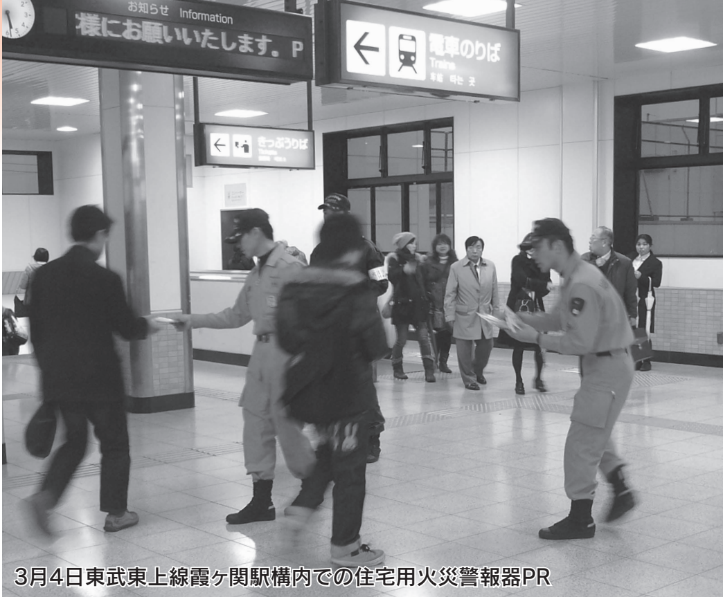
3月4日東武東上線霞ヶ関駅構内での住宅用火災警報器PR