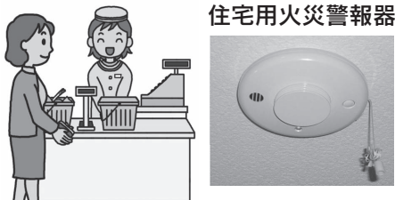
住宅用火災警報器