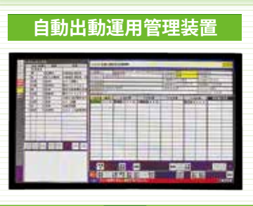
自動出動運用管理装置