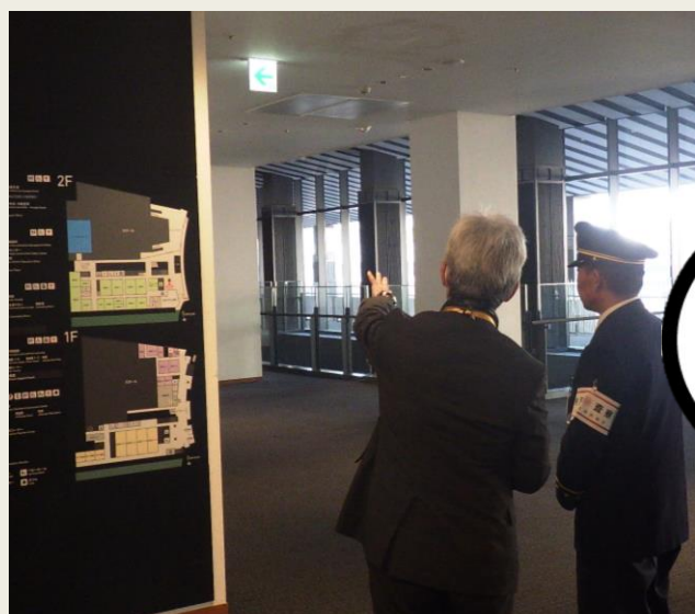
避難口・避難経路の検査状況