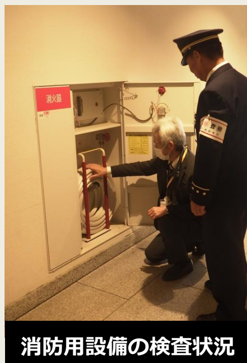
消防用設備の検査状況