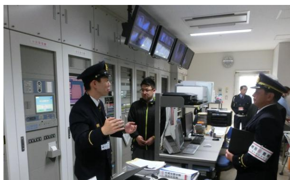
防災センター内の検査状況

検査結果は良好で、消防局長から直接、関係者に対し今後も引き続きこの状況を維持管理するとともに、建物及び利用者の安全確保と火災予防を訴えかけました。