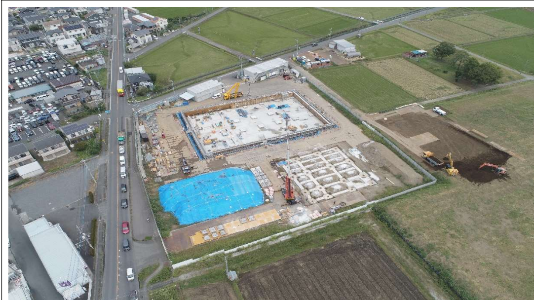
マットスラブ生コン打設の状況 [2024.9月下旬]