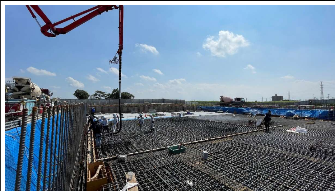
マットスラブ生コン打設の状況 [2024.9月上旬]