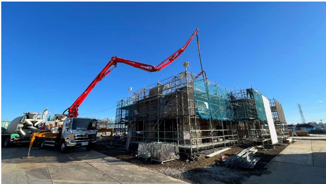
1階躯体生コン打設工事状況 [2025.12 月中旬]