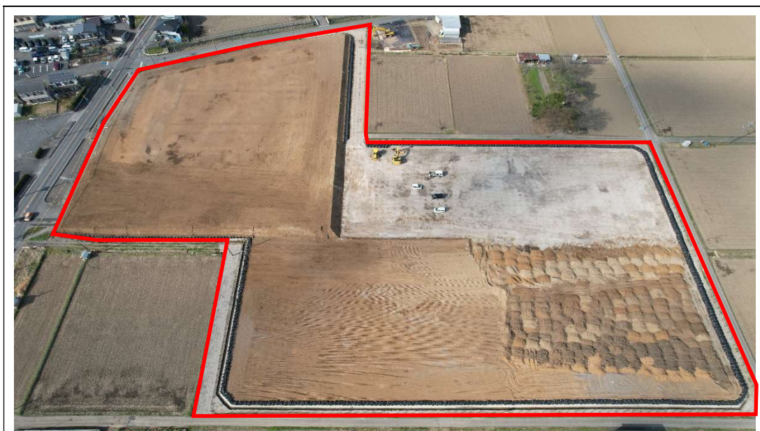
第1期盛土工完了 [2023.3月下旬] ※敷地南側上空から撮影