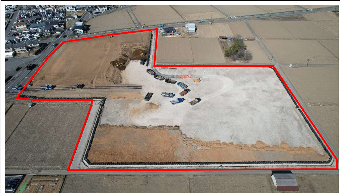
盛土工 [2023.2 月下旬] ※敷地南側上空から撮影