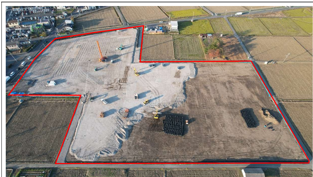
バーチカルドレーン工及びサンドマット敷設 [2022.11 月中旬] ※敷地南側上空から撮影