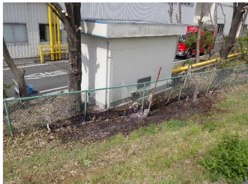
サイクリングロードからたばこを投げ捨て、 落葉に着火。