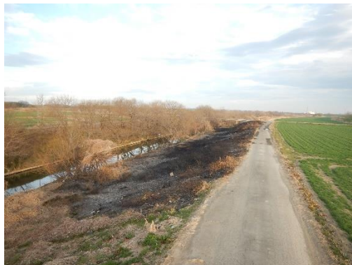
土手の枯草に着火。 約1750平方メートル焼損。