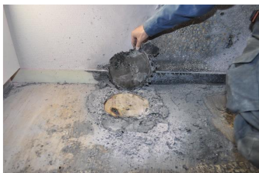
火種が消えていないたばこを、ゴミ箱に捨てて 時間経過したのち出火。