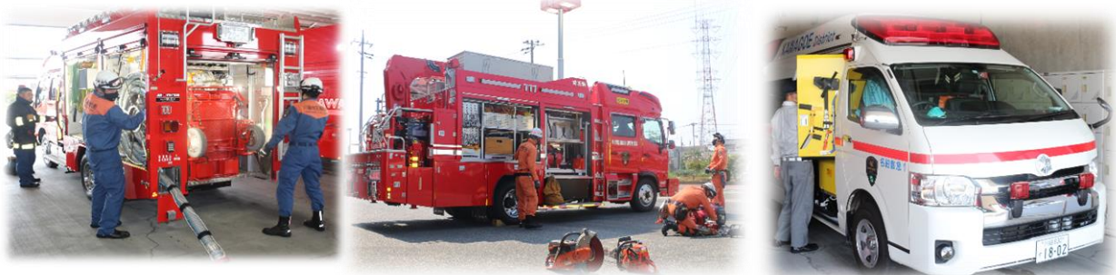
（車両点検及び機械器具点検）