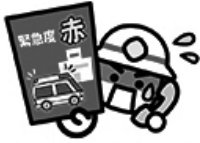
救急車を呼びましょう！