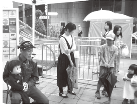
腹話術を用いた講話