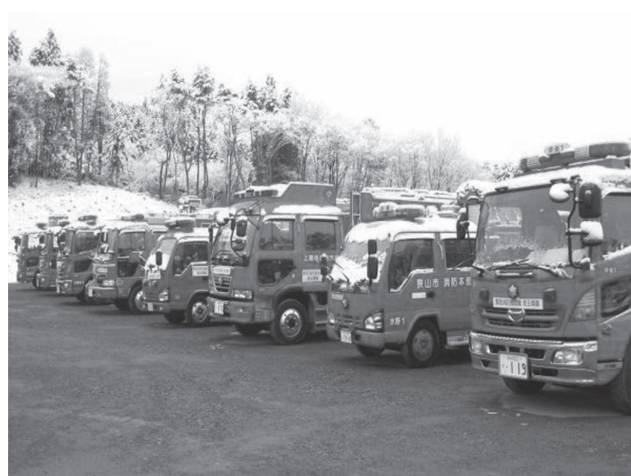
被災地の集結場所にて出動に備える 緊急消防援助隊埼玉県隊の消防車両

福島県への派遣は5月4日(水)までに4回の隊員交代により、延べ36名を派遣し、今後も継続される予定です。