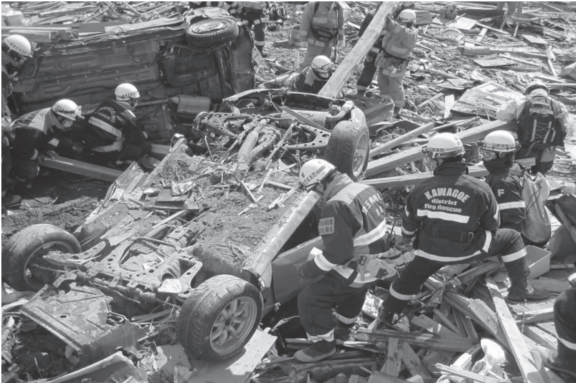
大量のがれきの中、検索救助活動にあたる緊急消防援助隊埼玉県隊