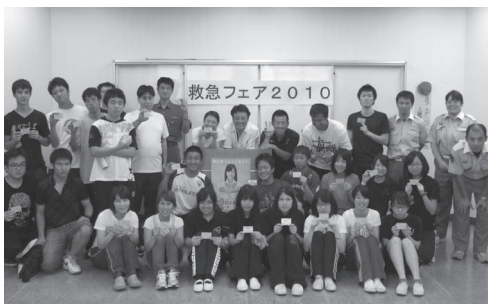
昨年度の上級救命講習修了者集合写真

上級救命講習の 申し込み先電話番号 【消防局救急課】 TEL049-222-0160