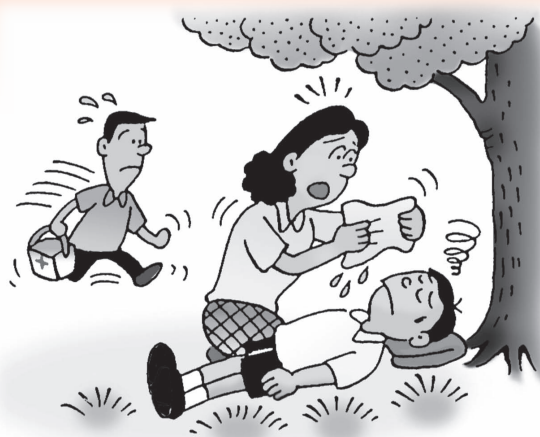
熱中症には迅速な応急処置が必要です。

今年もまた、暑い夏がやってきます。全国的な節電の実施により、高温多湿になった室内での熱中症が増加することが予想されます。 熱中症は、高温多湿の環境下において体温を下げるための汗が蒸発しないため、皮膚からの放熱ができず、体温調節ができなくなることが主な原因で発症し、気分不快、吐き気、頭痛、めまい、けいれん、筋肉の痛みなどの症状が生じ、ときには死に至る場合があります。 では、熱中症対策はどのようなことに注意すればよいのでしょうか？