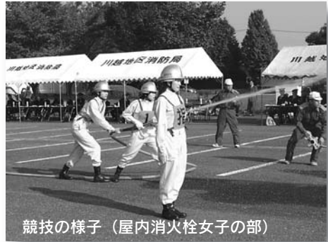
競技の様子（屋内消火栓女子の部）

昨年十月二十四日、川越水上公園で第二十二回自衛消防隊消防操法競技大会が、川越地区消防局と川越地区危険物安全協会の共催で開催されました。