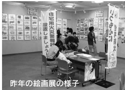
昨年の絵画展の様子

春季全国火災予防運動の実施に伴い、当組合管内の幼年消防クラブによる絵画展を開催します。