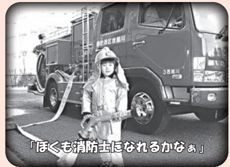
「ほくも消防士になれるかなあ」