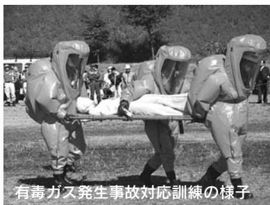
有毒ガス発生事故対応訓練の様子

昨年十月二十日・二十一日、群馬県前橋市で「平成十九年度緊急消防援助隊関東ブロック合同訓練」が行われ、当組合からは、救助隊及び後方支援隊が訓練参加し、本番さながらの緊張感の中、各種訓練を実施しました。