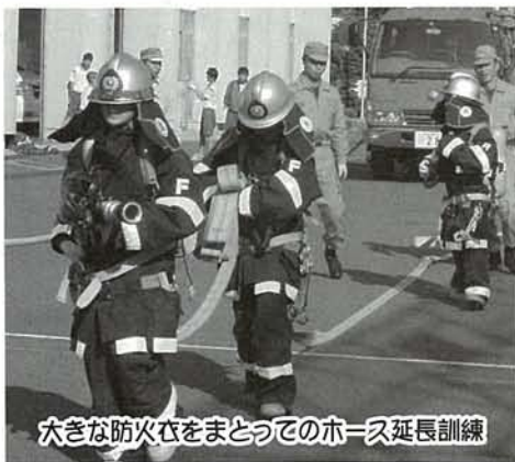
大きな防火衣をまとってのホース延長訓練

生徒たちは、礼式訓練・消火訓練・放水訓練などを体験し、ふだんでは体験できないことに「人を助けることはこんなにたいへんだとは思わなかった」「消防署の人は優しかった」などの感想を述べていました。