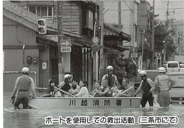
ボートを使用しての救出活動 (三条市にて)

昨年発生した新潟県の豪雨災害や新潟県中越地震に、救助隊・消防隊・救急隊などを緊急消防援助隊として派遣しました。