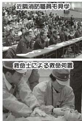
救命士による救命処置