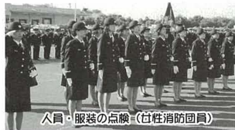
人員・服装の点検 (女性消防団員)

上田清司 埼玉県知事ははじめ多数の来賓の前で、人員・服装および車両など、点検を受けました。