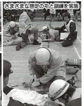
さまざまな想定のもと訓練を実施

平成十六年十二月十六日・十七日の二日間にわたり、川越市運動公園総合体育館において、救急想