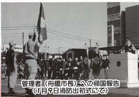
管理者（舟橋市長）への帰国報告（1月9日消防出初式にて）

隊とは、海外における大規模な災害に対して、被災国の要請で派遣される国際緊急援助隊の救助チームで、消防・警察・海上保安庁等の精鋭で構成されています。