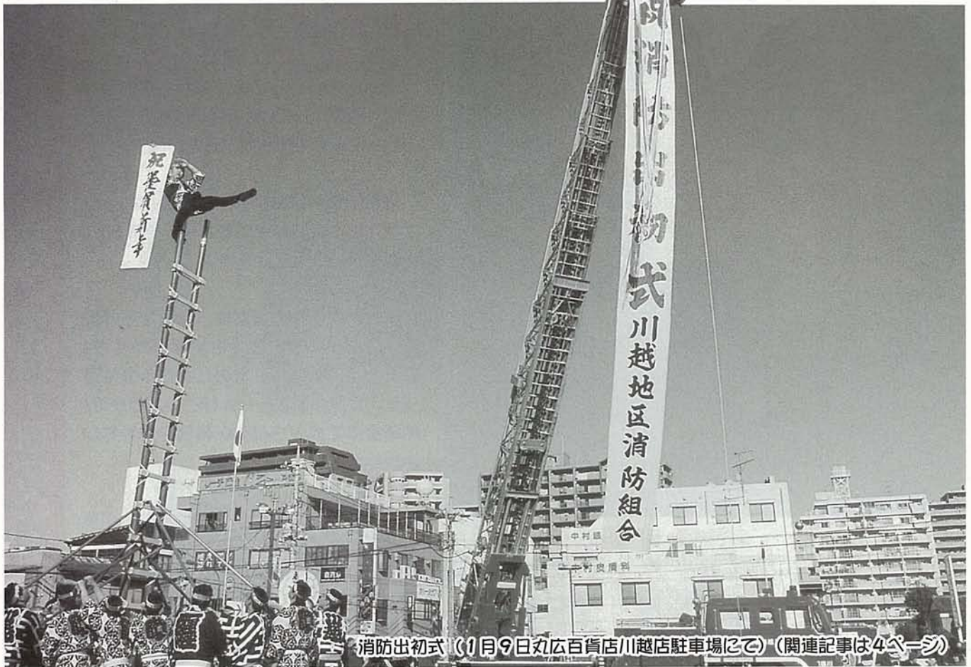
消防出初式（1月9日丸広百貨店川越店駐車場にて）（関連記事は4ページ）