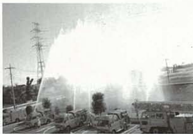
消防団による一斉放水 (二月八日川島消防署にて)

ことしも一年、災害のない穏やかな年であるように願いを込めて、消防団による一斉放水や防火パレードも行われました。