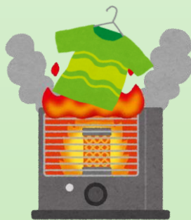
燃えやすいものを 近くに置かない