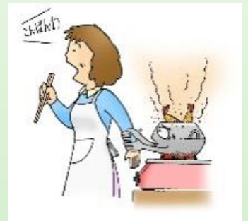
火から目を離さない