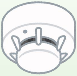
住宅用火災警報器を設置する