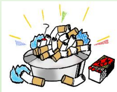
吸殻を灰皿にためない