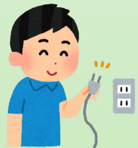
コンセントに埃をためない